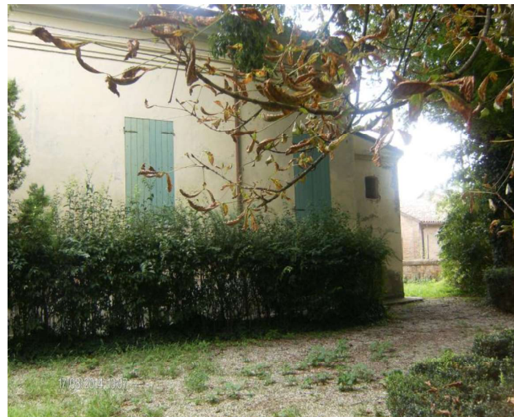
INGRESSO FACCIATA PRINCIPALE SULLA VIA GARIBALDI