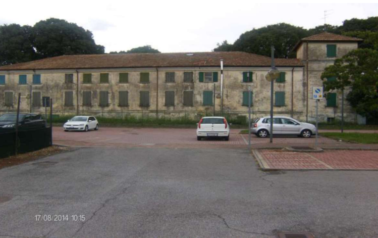
COMPLESSIVO FACCIATA POSTERIORE