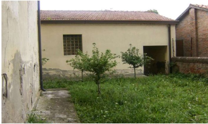
APPENDICE CON PASSAGGIO PER LOCALI SEMINTERRATO