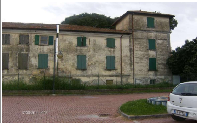
FACCIATA POSTERIORE LATO TORRETTA