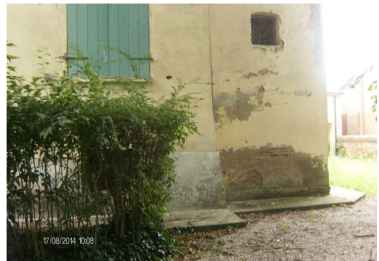
LATO DESTRO FACCIATA CON APPENDICE ARCHIVIO