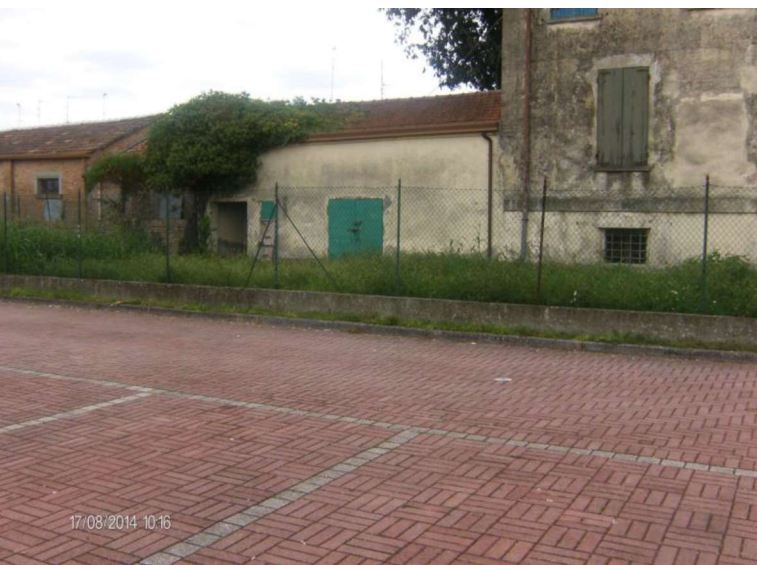
RETRO PASSAGGIO PER LOCALI SEMINTERRATO