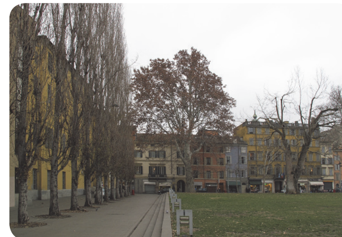
2 . Le alberature storiche di Piazzale della Pace viste sullo sfondo di Strada Garibaldi.