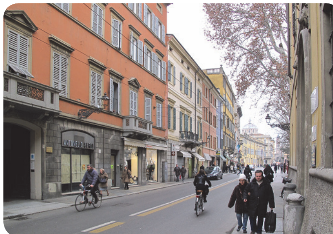
1 . Percorrendo Strada Giuseppe Garibaldi, provenendo dalla stazione, sulla dx, si intravedono le chiome delle piante di Piazzale della Pace.