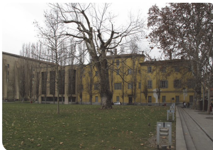
3 . L'area a verde pubblico antistante il complesso monumentale della Pilotta.