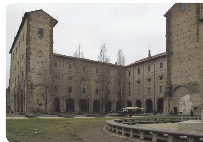
4 . Un altro scorcio dell'area pubblica sullo sfondo del complesso della Pilotta.