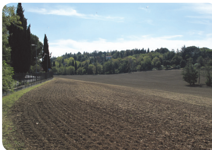
3 . A sinistra via Covignano; sullo sfondo la massa boscata della Via Crucis.