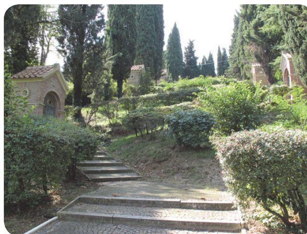
7 . Via Crucis; si notano le numerose cappelle.