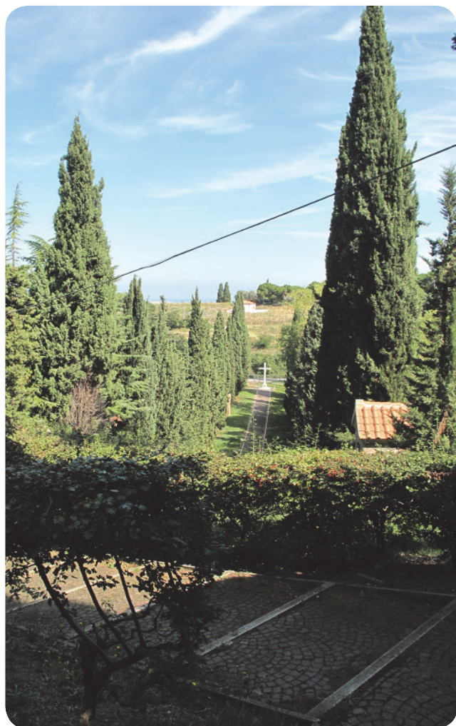
5 . Via Crucis; sullo sfondo la croce in marmo dietro la quale scorre via Covignano.