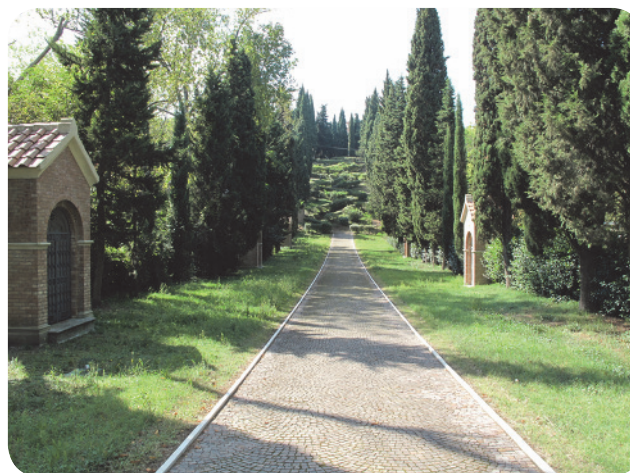
6 . Via Crucis, guardando verso viale Grazie.