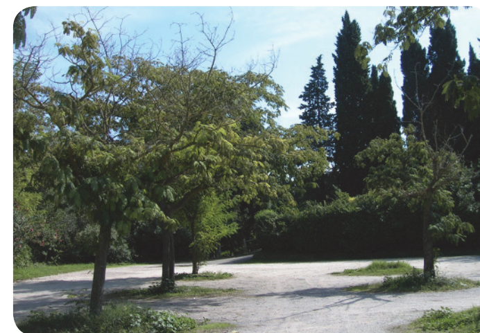
4 . Parcheggio attiguo alla via Crucis.