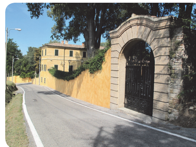
9 . Viale Grazie; una delle numerose ville presenti all'interno dell'area tutelata.

nota: L'area del Colle alle Grazie è attualmente sottoposta a due dichiarazioni di notevole interesse pubblico, perciò, in coerenza con le altre schede dell'Atlante, dovrebbe essere compilata la sezione relativa alla sovrapposizione di due beni paesaggistici. Però, considerato che non è stato possibile ricavare le motivazioni della tutela del bene paesaggistico 139 e considerato che è possibile verificare il livello di sovrapposizione dei perimetri dei due beni paesaggistici attraverso la consultazione della copertina della presente scheda, non si ritiene necessaria la redazione della suddetta sezione e si procede quindi alla sola presentazione degli stralci del PTPR e del PTCP relativi al bene paesaggistico 203.