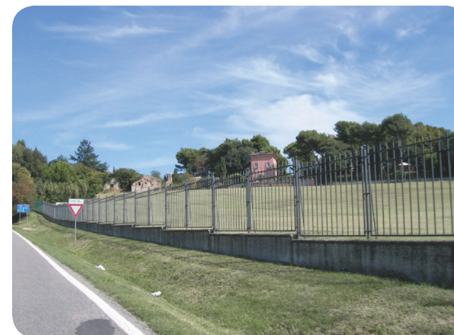
8 . Via Santa Cristina, limite settentrionale del bene paesaggistico 139.