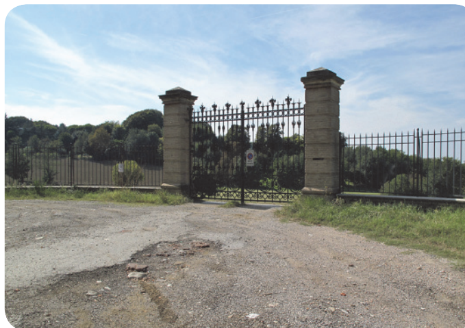
1 . Cancelli di ingresso su via Covignano.