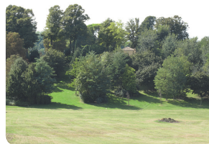
2 . Dettaglio del Colle alle Grazie visto da via Covignano.