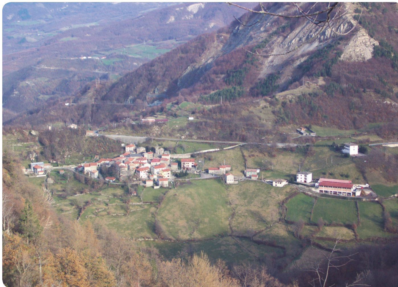
1 . Veduta di Cecciola da Miscoso.

Nelle incisioni orografiche dell'Enza e del Liocca si notano formazioni ripariali igrofile a dominanza di Salice Bianco e Pioppo nero. Sulle pendici del Monte Lungo la vegetazione è costituita da boschi con dominanza di Faggio.