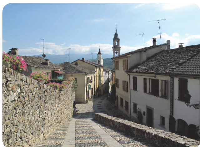
8 . Via Marco Rossi Sidoli, la spina centrale del borgo di Compiano, che connette il Castello alla chiesa di S. Giovanni Battista e all'adiacente belvedere.