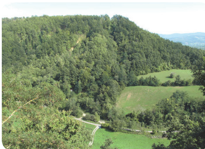
3 . Veduta panoramica.