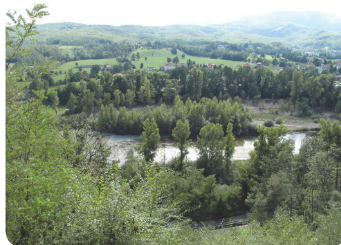
4 . Veduta sul fiume Taro e il lussureggiante paesaggio che lo circonda.