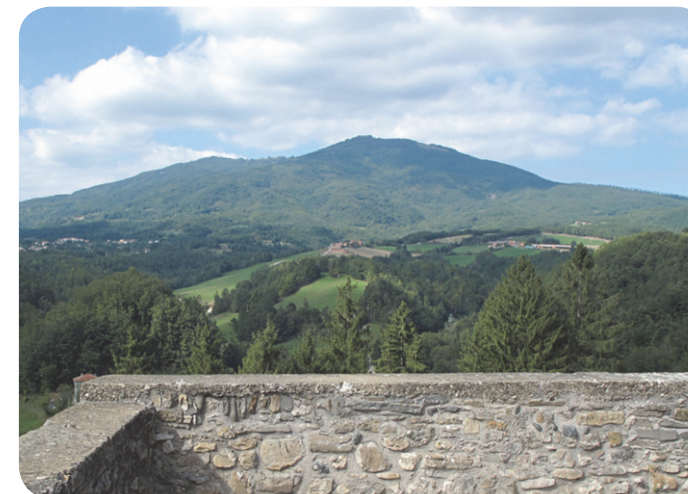
2 . Belvedere verso la campagna e il territorio circostante.