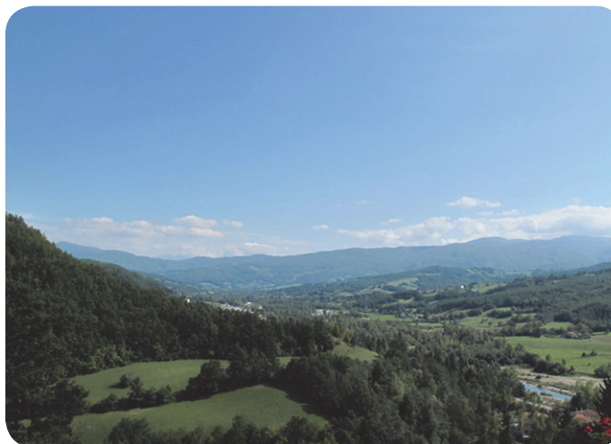
1 . Veduta verso il territorio circostante, da Compiano.