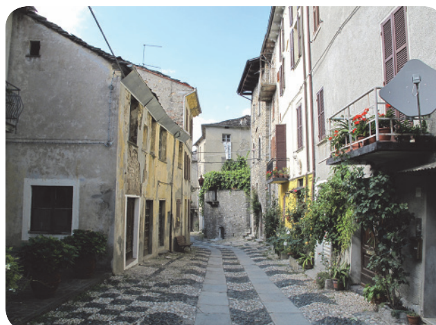
7 . Un'immagine che evidenzia l'ottimo stato di conservazione del borgo e la qualità diffusa del costruito, nonostante la sua semplicità compositiva.