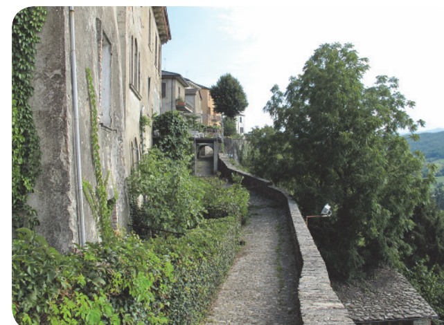
8 . Il percorso panoramico che costeggia borgo.