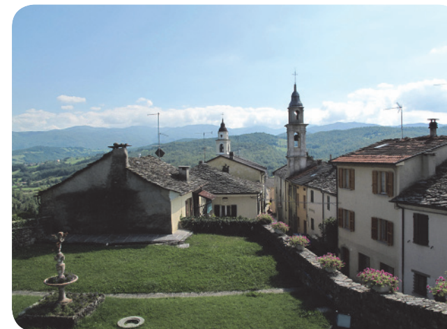
7 . Il giardino pensile presente all'interno del borgo, alle cui spalle si notano i campanili della pieve di S. Paolo (a dx) e della chiesa di S. Giovanni Battista (a sx).