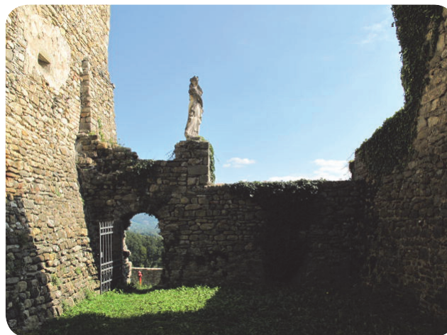
6 . Un dettaglio che denota la raffinatezza espressa dall'imponente fortificazione.