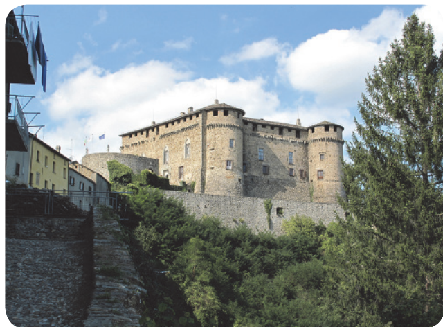
5 . Il castello di Compiano, che, dal giugno 2012, è nuovamente aperto e offre diversi servizi: museo, hotel, relais, sale per congressi ed eventi.