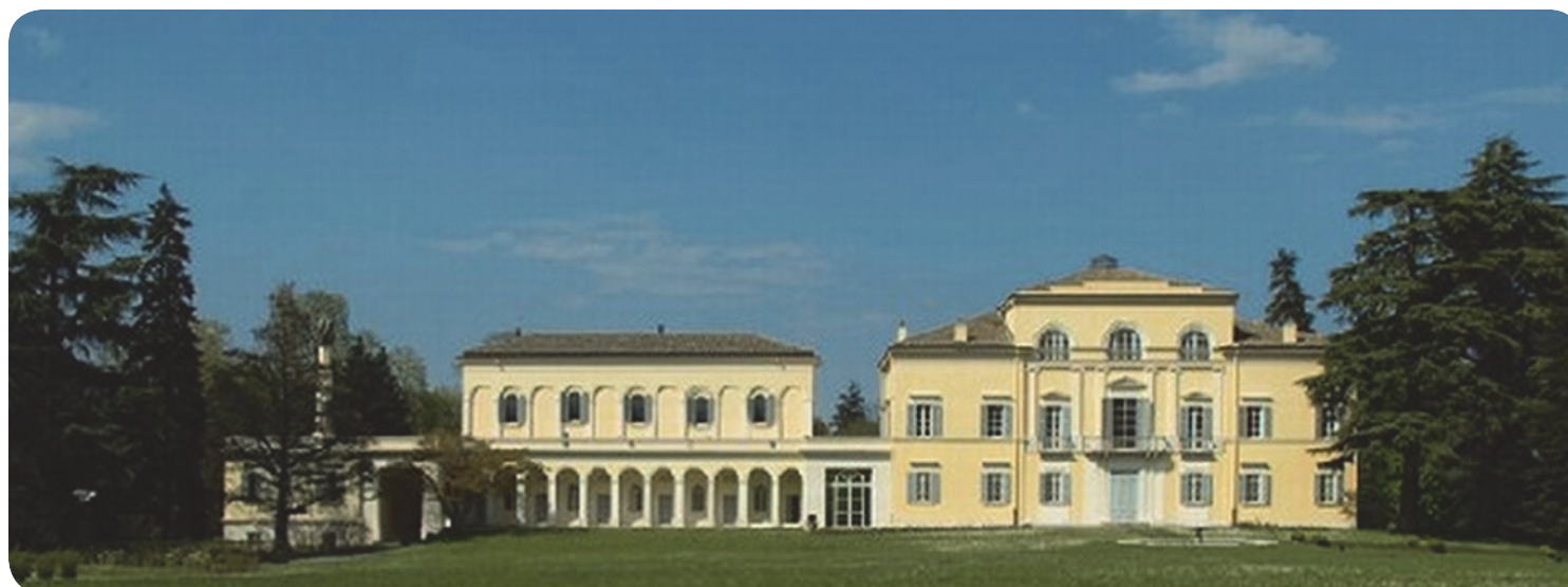
3 . Tenuta del Ferlaro. Prospetto principale.