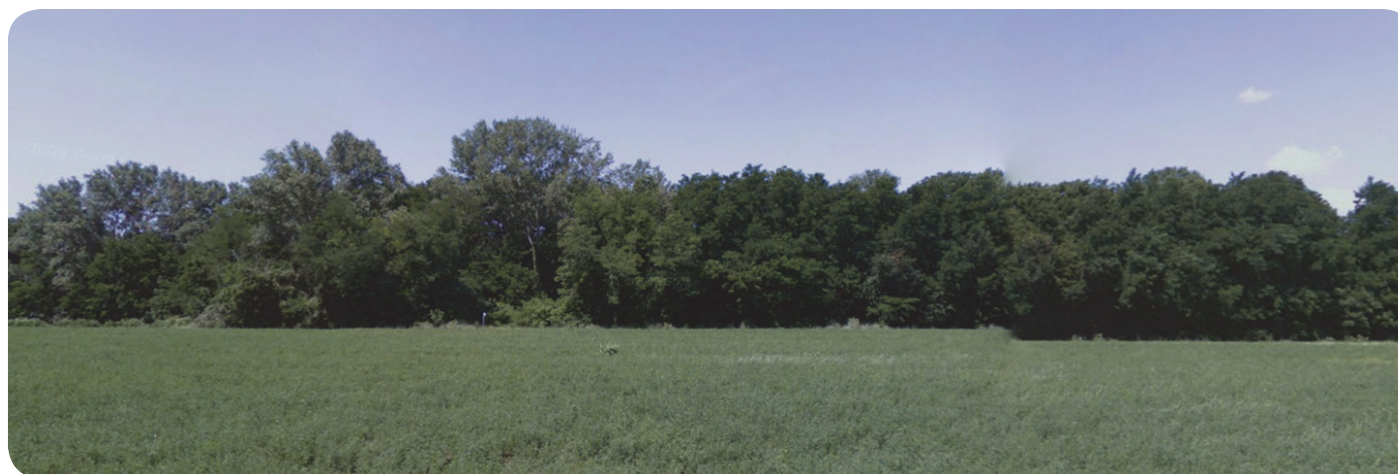
1 . I Boschi di Carrega. veduta dalla strada provinciale 58 proveniente da Collecchio.