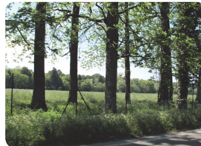
3 . Strada panoramica. Sulla sinistra i Boschi di Carrega.