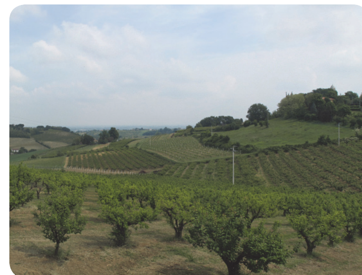
4 . L'immagine vuole rendere conto del ricco ed eterogeneo contesto agricolo tradizionale caratterizzante il territorio che, per buona parte del tragitto, costeggia via Goccianello.