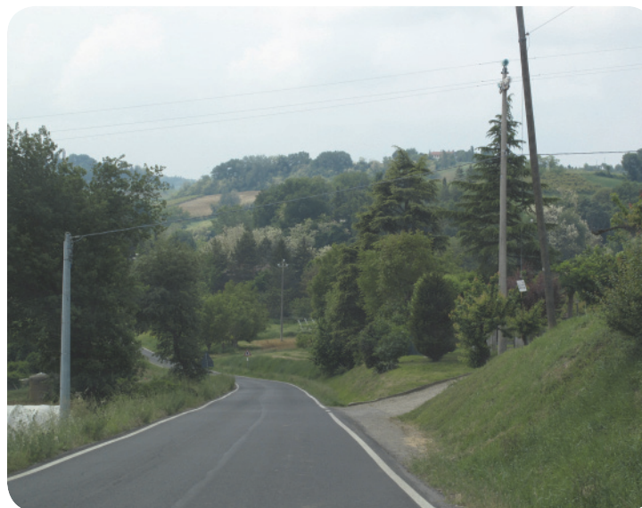
1 . La parte iniziale di via Goccianello, provenendo da Imola (sulla destra si vedono alcuni esemplari di pini delle regioni appenniniche).

D'altra parte, pur avendo percorso l'intero tratto della via, non è stato in alcun modo possibile identificare un filare di pini che potesse essere collegato alla tutela. Come si può notare dalle immagini, nei pressi di strada Goccianello sono presenti molti alberi ad alto fusto (non disposti in ordinati filari), tra i quali si possono riconoscere sia esemplari di pinus pinaster (immagine 3), sia esemplari di pini delle regioni appenniniche (immagini 1 e 2). La diffusione e la diversificazione degli esemplari di pini, complica ulteriormente la situazione, portando alla convinzione che non sia ormai più possibile identificare quale potesse essere l'oggetto della tutela.