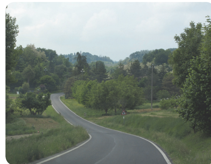
2 . Proseguendo lungo strada Goccianello, si possono scorgere, sullo sfondo, altri esemplari di pini delle regioni appenniniche.