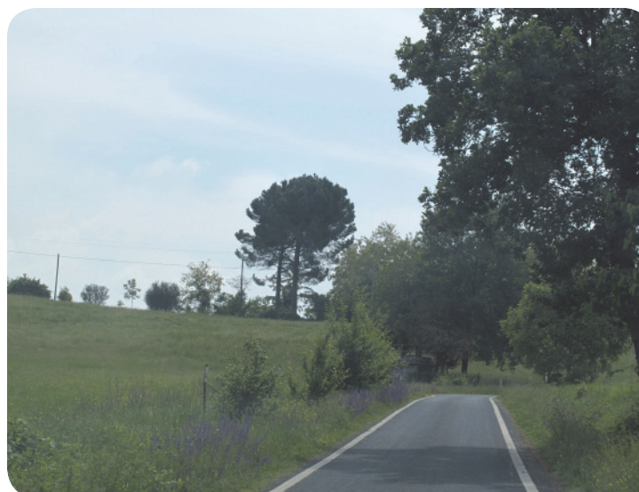
3 . Si evidenzia la presenza, lungo via Goccianello e ormai in zona Felicieto, di alcuni esemplari (non filari) di pinus pinea , essenza già tutelata in altri beni paesaggistici del ravennate.