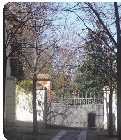
2 . Oltre l'accesso principale da via S. Stefano, vi è una seconda cancellata, oltre la quale si vede la vegetazione.