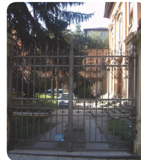
3 . Da via S. Giuliano, oltre il muro dietro la cancellata si percepisce il verde.