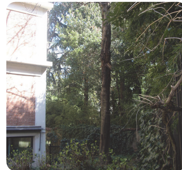
2 . L'area verde di pertinenza del palazzo in via Dante, interna al perimetro del vincolo.