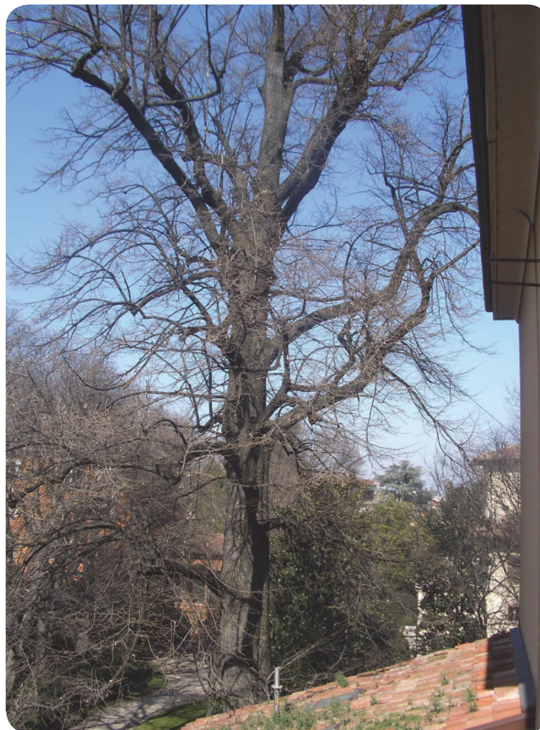
1 . Un grande albero del giardino dall'alto.