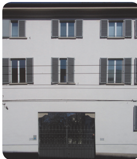
1 . Il cancello su via S. Stefano che occulta la vista del giardino.

Il perimetro del bene corrisponde alla sola proprietà Miliani (nel periodo di apposizione del vincolo) ed esclude altri giardini adiacenti, altrettanto densi di vegetazione. Infatti, il giardino, insieme ad altre aree verdi incluse in isolati storici vicini, rappresenta parte di un sistema di qualità del verde all'interno della città storica.