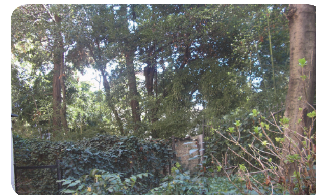
3 . Il giardino lussureggiante, oltre il muro della palazzina di via Dante.