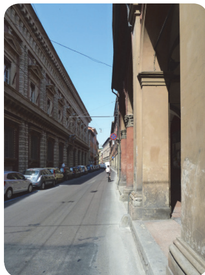
1 . Via S. Vitale, all'altezza dell'entrata del cortile tutelato.