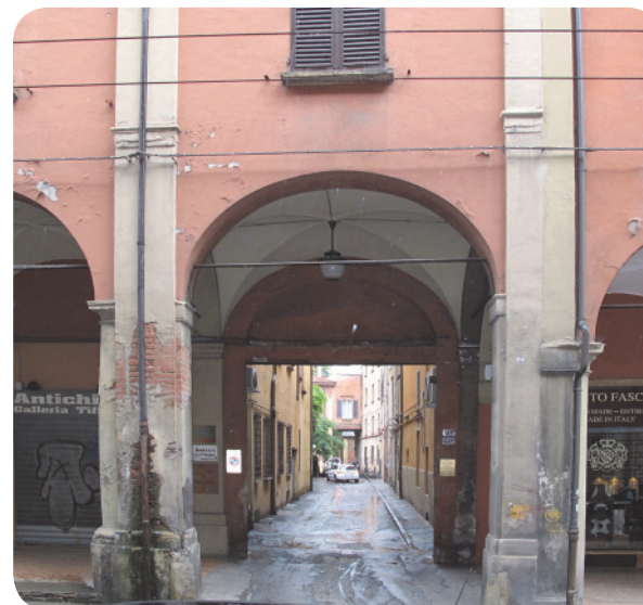
2 . L'entrata di via S. Vitale 40/2; dopo aver superato il portale di accesso, in fondo a sinistra si scorge la chioma di un albero della prima area tutelata.