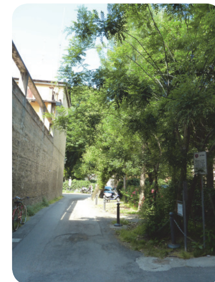
3 . Il primo giardino tutelato.