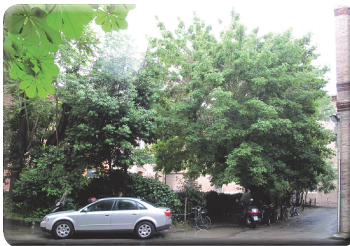
2 . Il primo giardinetto.