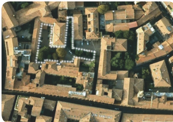
1 . Individuazione dell'area tutelata all'interno di via San Vitale.