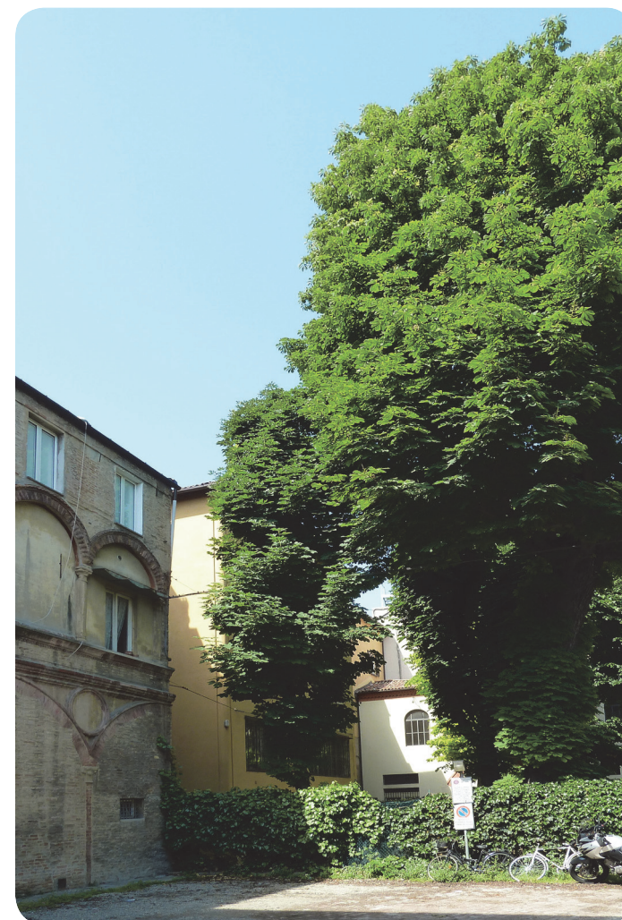
3 . Il secondo giardino tutelato.