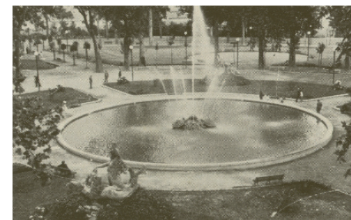
3 . La nuova Montagnola, “Il Comune di Bologna”, A.XXI, n.16, giugno 1925, p.69 (Biblioteca Comunale Archiginnasio, Bologna).