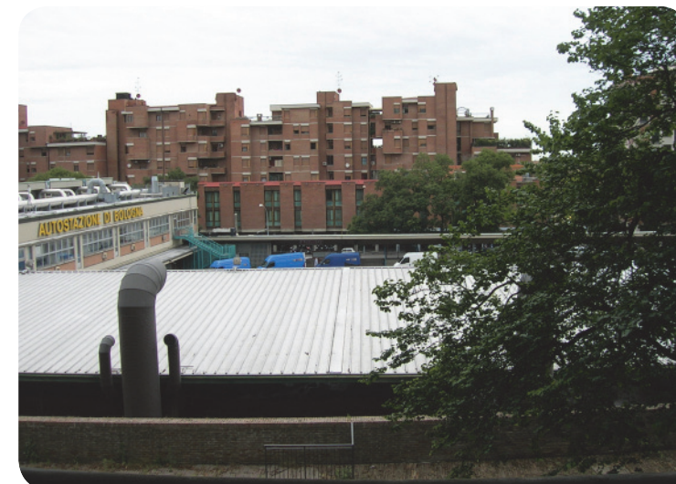
7 . Dalla balconata del parco verso il piazzale delle corriere dell'autostazione.