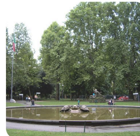
2 . La zona centrale della Montagnola.