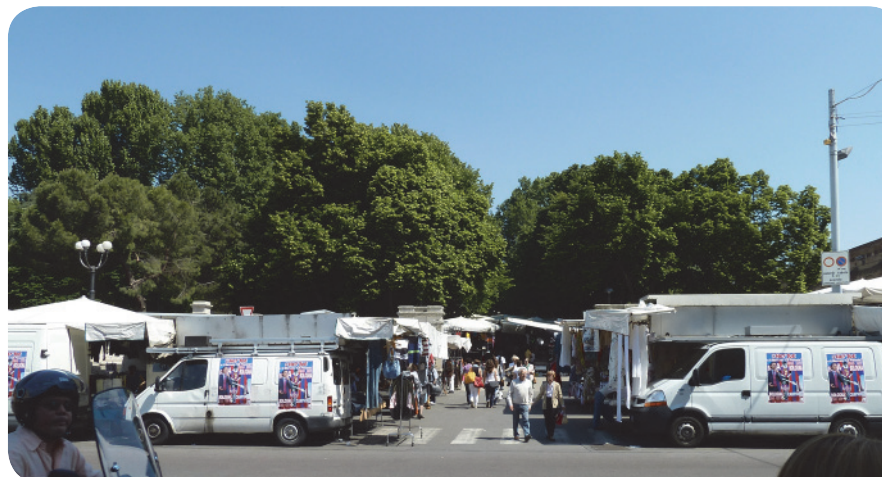
1 . Il Parco della Montagnola in un giorno di mercato: un ombrello di alberi.