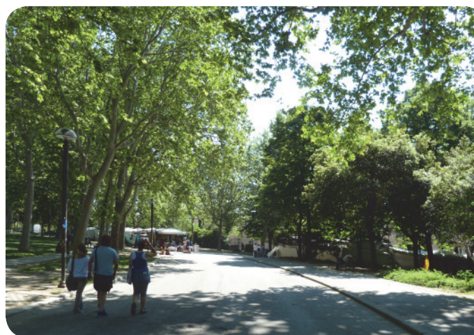
3 . Intorno alla fontana.