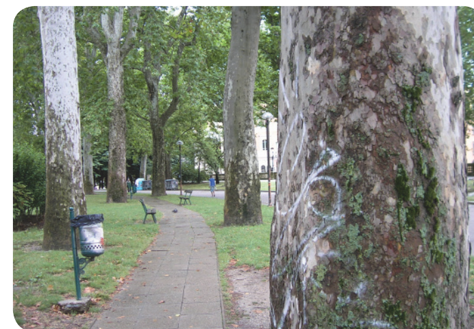
4 . La vegetazione del parco, lungo uno dei vialetti interni.