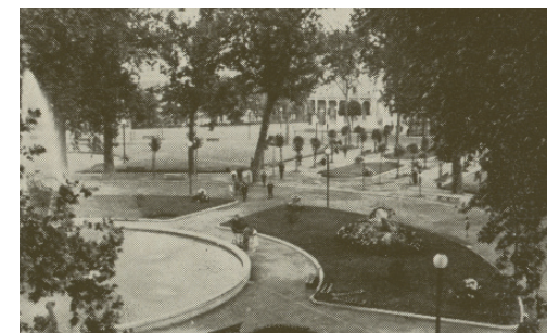
2 . La nuova Montagnola, “Il Comune di Bologna”, A.XI, n.11, novembre 1925, p.69 (Biblioteca Comunale Archiginnasio, Bologna).