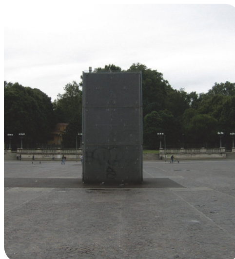
4 . Da viale Angelo Masini: la visuale viene filtrata dalla cortina dell'autostazione, rendendo difficoltosa la percezione della morfologia del parco.