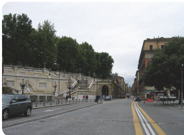
1 . Da piazza XX settembre: la cosiddetta scalinata del Pincio e l'inizio di via Indipendenza.

Il giardino alla francese, leggermente sopraelevato rispetto alle aree circostanti, ha un corpo alberato