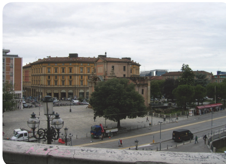
6 . Dalla balconata del Pincio: si può ammirare l'eterogeneo paesaggio a nord della città (Porta Galliera, piazza XX Settembre e l'impianto urbano più contemporaneo [sullo sfondo la nuova sede del Comune]).

Il parco, insieme a piazza VIII agosto, ospita tradizionalmente il più ampio mercato settimanale (venerdì e sabato) della città, trasformando l'area (generalmente poco vissuta) in un luogo di scambio e di incontro.