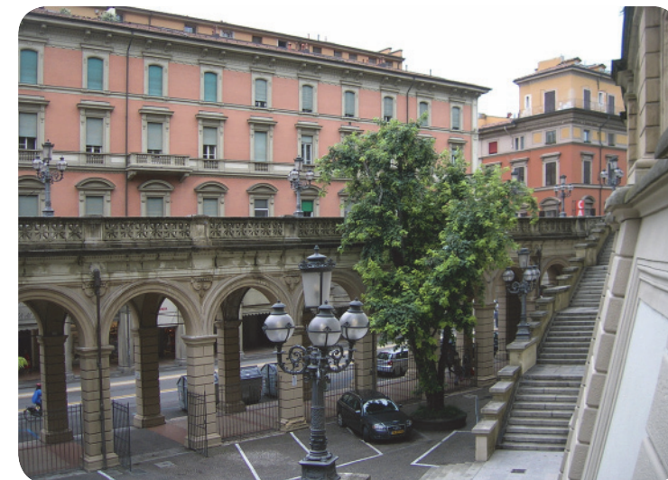
2 . Dalla balconata del parco: la scalinata di via Indipendenza (a sinistra si vedono i portici di via Indipendenza e la cancellata [chiusa durante la notte]). L'accesso non è ben visibile in quanto l'entrata è sita in continuità con la cortina edilizia.