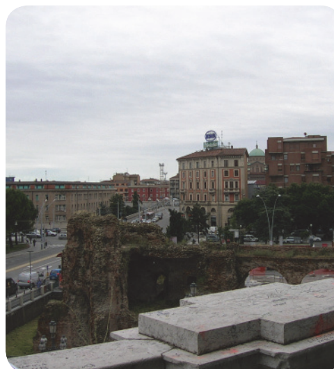
9 . Dalla balconata del parco su via Indipendenza: cono prospettico verso nord.