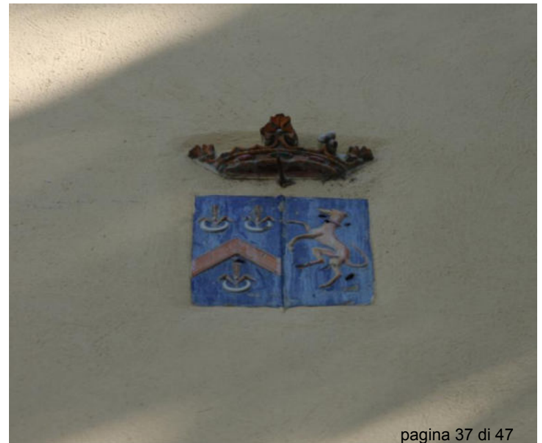
7. Lo stemma dei Sampieri Talon sulla facciata dell'Oratorio