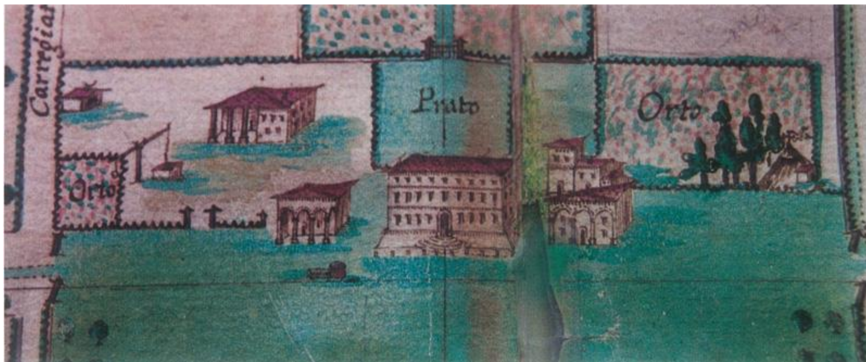
Dettaglio della planimetria del perito agrimensore Bartolomeo Bonacursi (1719)