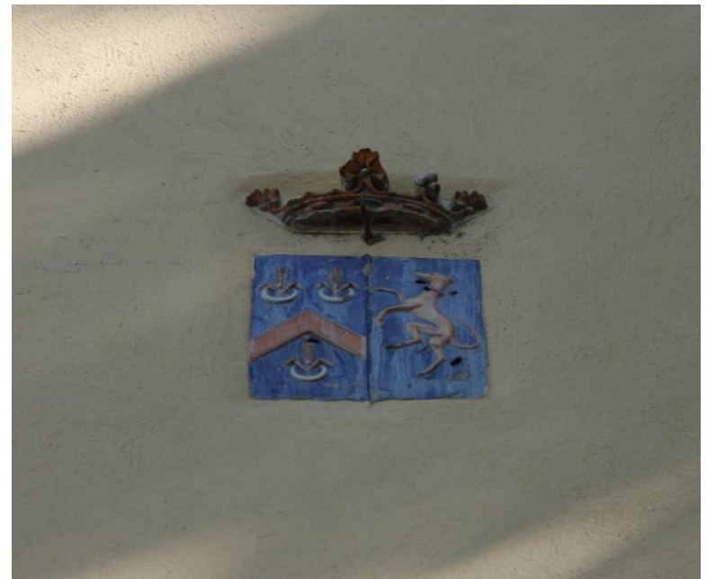
7. Lo stemma dei Sampieri Talon sulla facciata dell'Oratorio