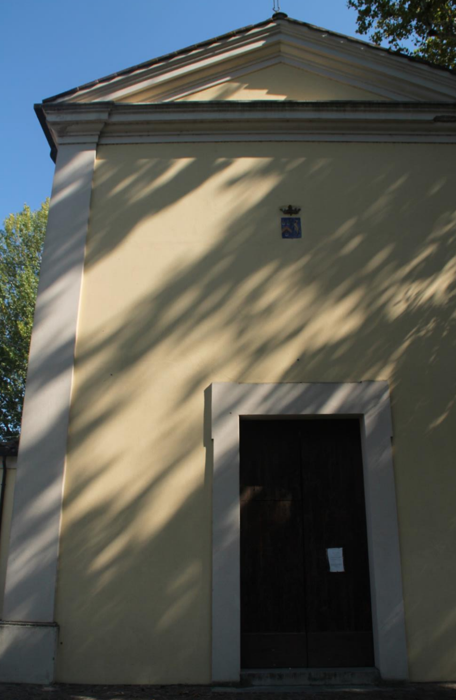
6. L'Oratorio di San Donino