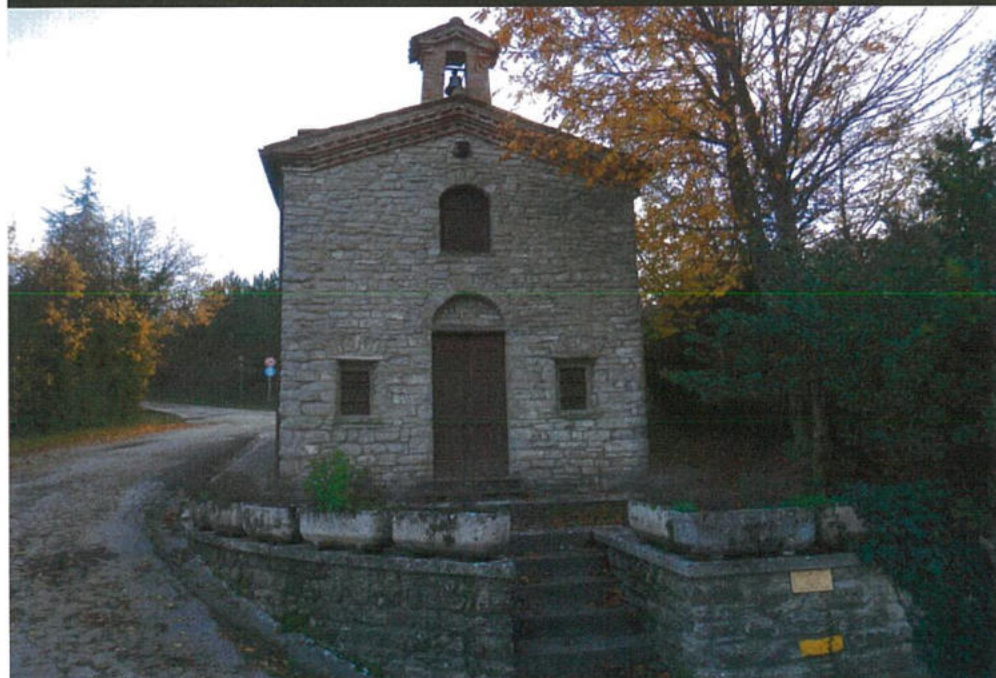
Tratto 3-7: dal bivio per Casaglia-Faenza-Zattaglia al bivio fra via Ronzano e via Monte Romano