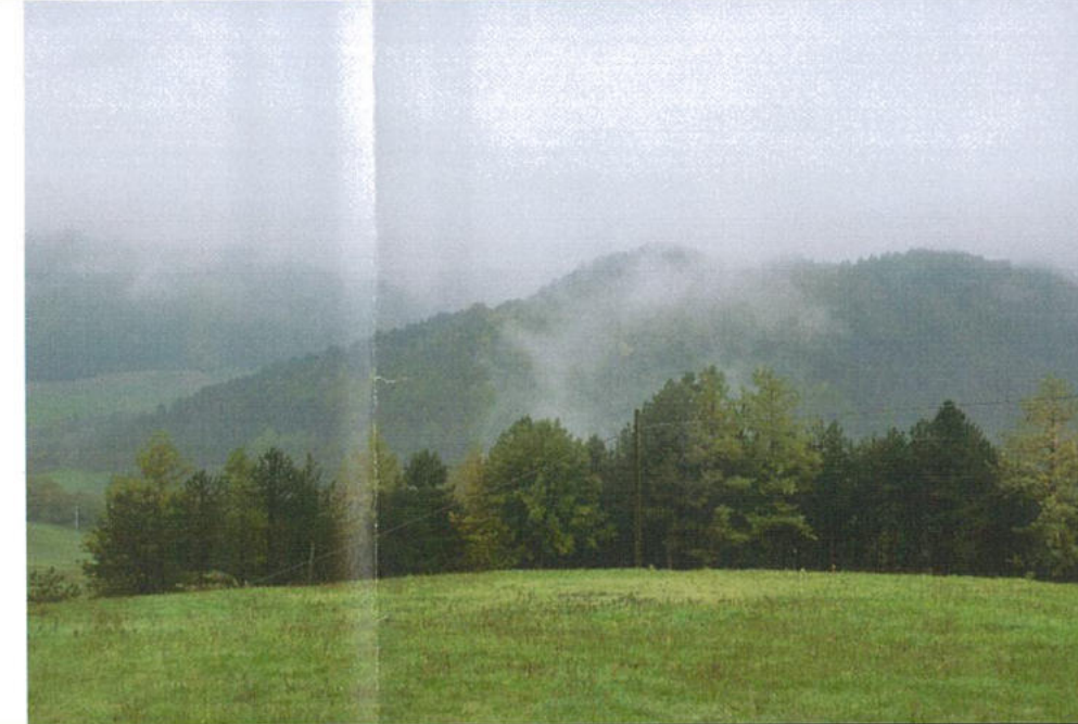
Tratto 3-7: dal bivio per Casaglia-Faenza-Zattaglia al bivio fra via Ronzano e via Monte Romano