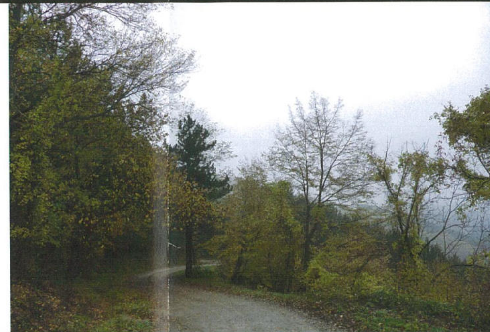
Tratto 3-4: dal bivio per la strada Casaglia-Faenza-Zattaglia alla strada forestale Canova dei Topi - bivio Sintria