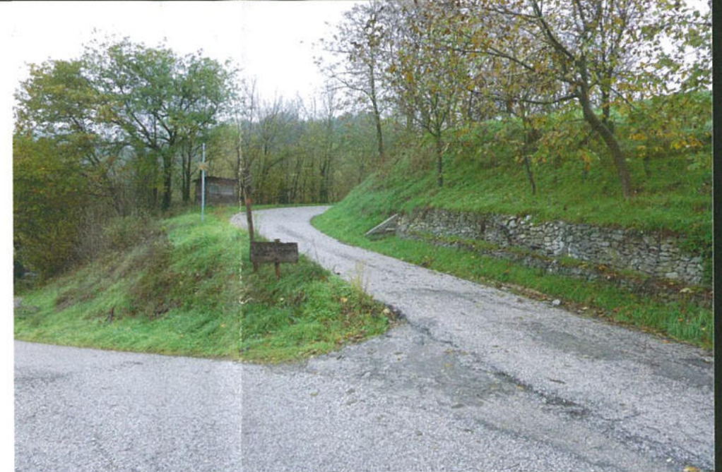
Tratto 6-7: dall'incontro fra il confine comunale, lato sud, con la via Valnera fino al bivio fra via Ronzano e via Monte Romano