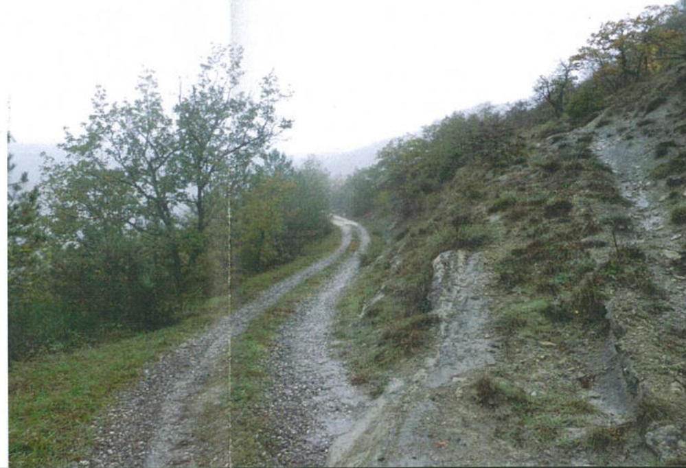
Tratto 1-2: dalla loc. San Cassiano all'incrocio tra la SP 302 Brisighellese e la via Corneto al bivio tra la strada forestale Cà di Po e la via Monte Romano