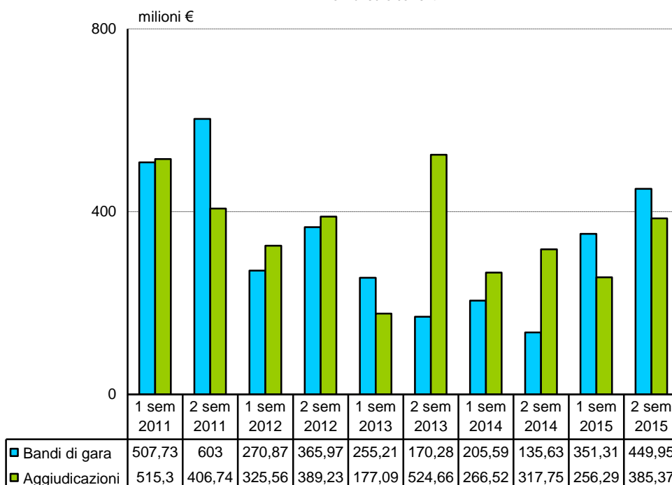
Fig. 2 - Importi dei contratti pubblici di lavori in Emilia-Romagna milioni di euro correnti

Le elaborazioni di seguito riportate fanno riferimento ai lavori messi a gara dalle Pubbliche Amministrazioni sul territorio regionale, integrando i dati pubblicati dal sistema informativo SITAR per le amministrazioni d’ambito regionale con quelli del sistema SIMOG per le amministrazioni d’ambito statale e sovra-regionale.