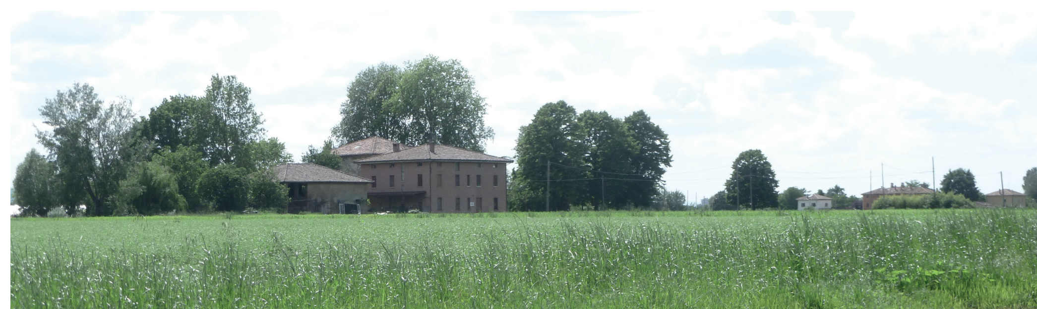
Corte rurale storica, centro dell'attività agricola con vendita diretta degli ortaggi prodotti

Il cuneo agricolo a nord est di Bologna è paradigmatico e ci mostra i caratteri dei contesti agricoli periurbani, in particolare di pianura. Lo schema mette in rilievo, per questo ambito, gli elementi di contrasto, ciò che è da riscoprire, in quanto appare a molti come segreto, e i sistemi ai quali possono essere attribuiti ruoli di attivatori di sinergia.