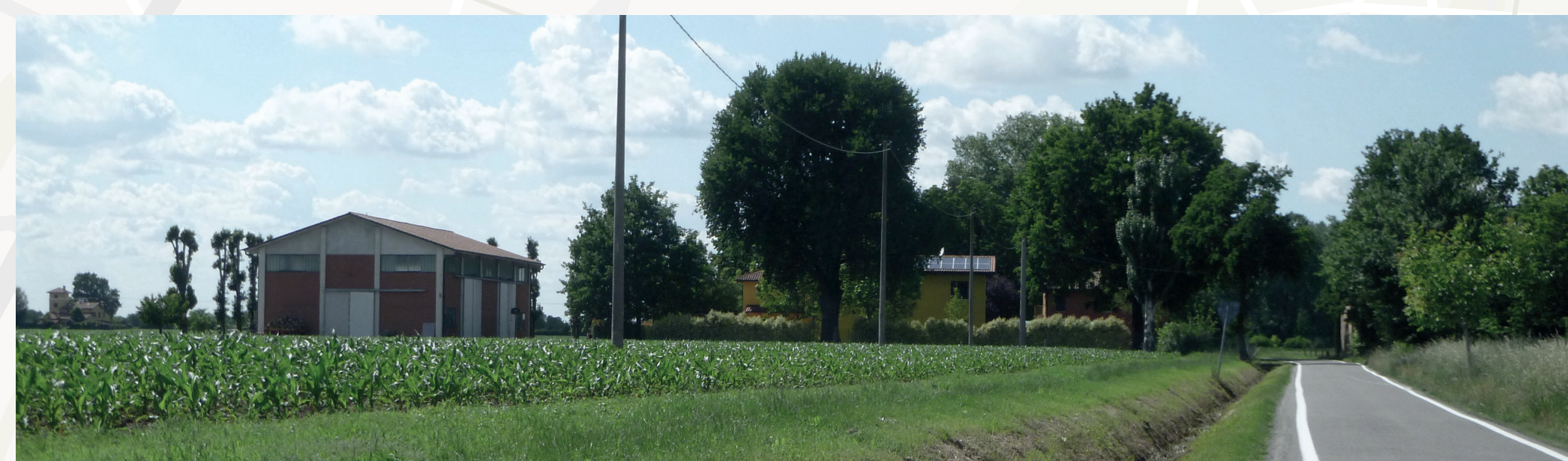
Nuovi fabbricati per le attività produttive agricole edificati in aderenza ad un'azienda agricola