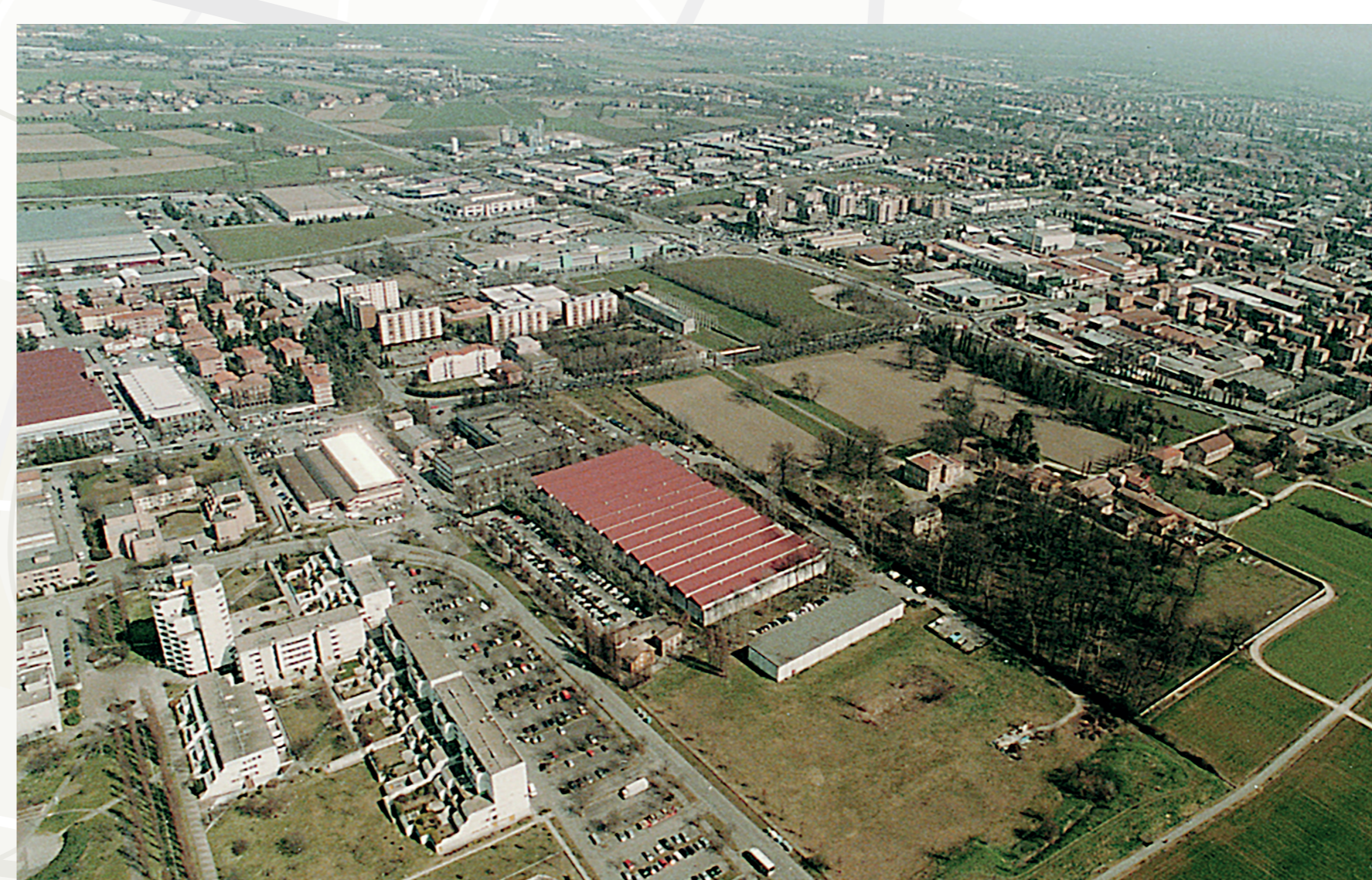
Periurbano di cintura