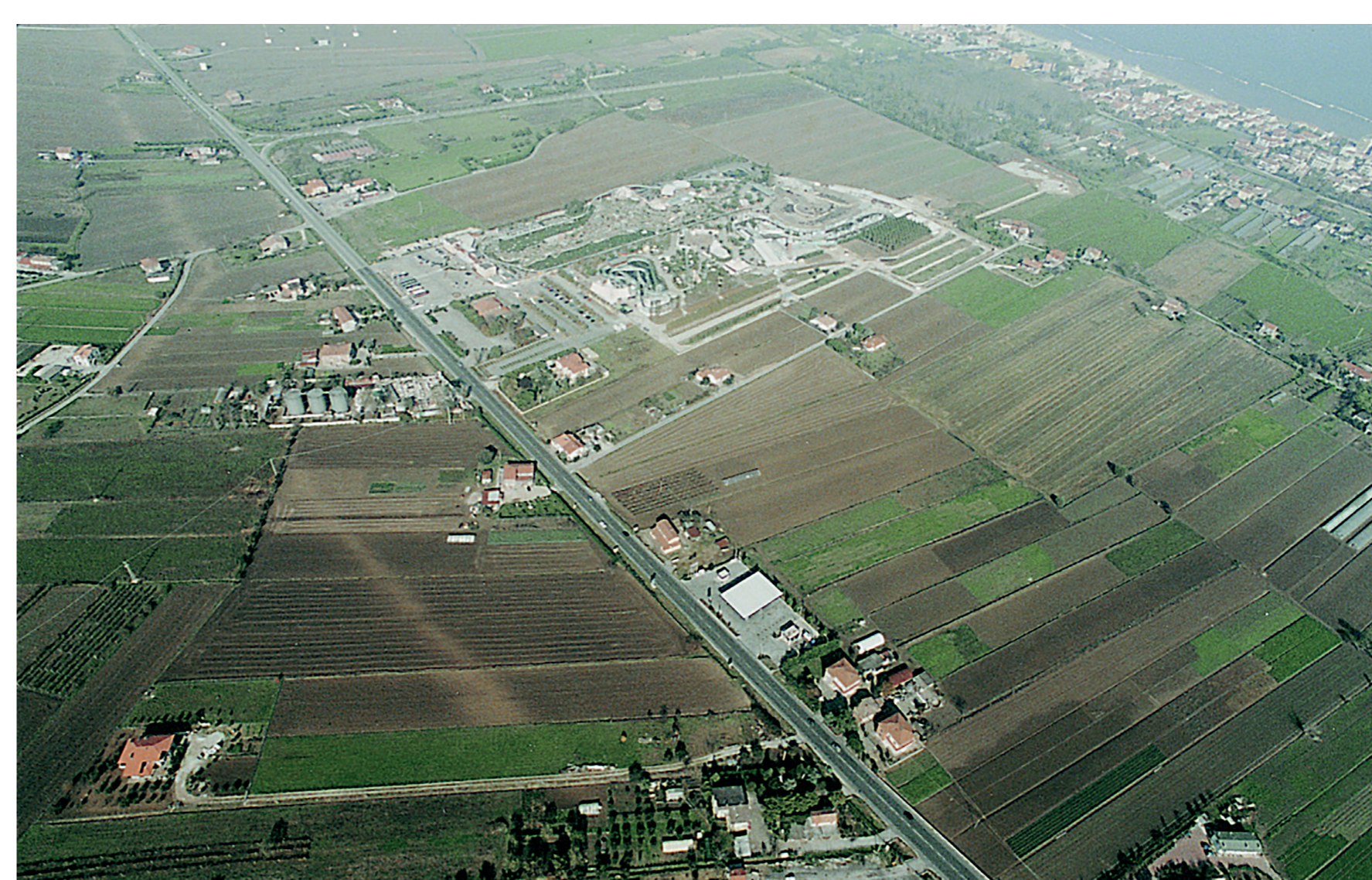
Periurbano costiero e retrocostiero