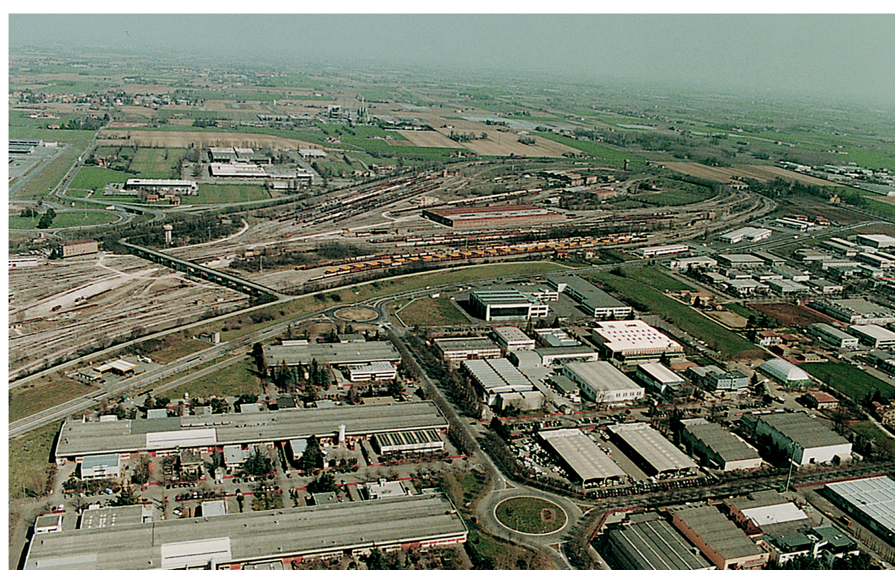
Periurbano metropolitano