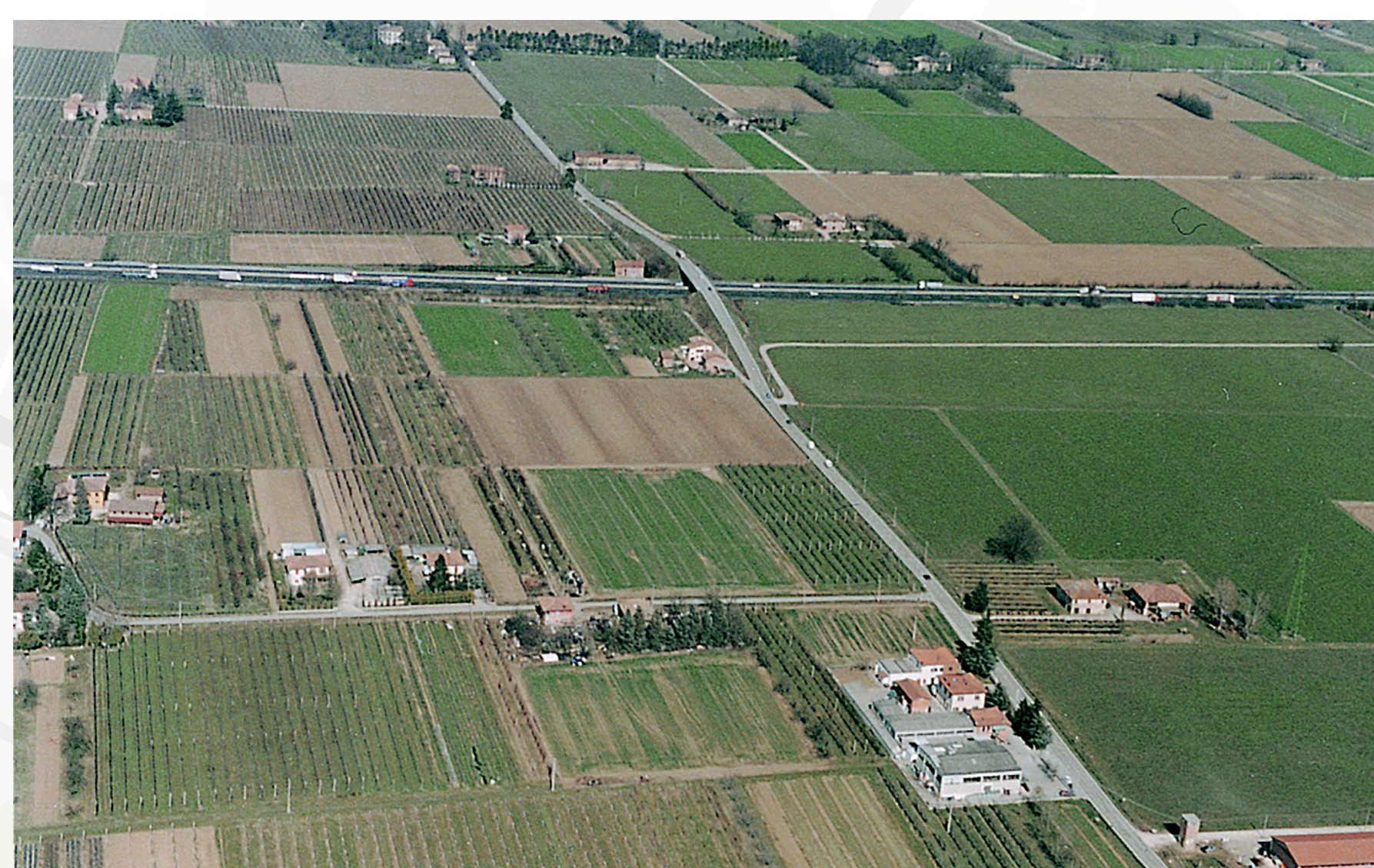
Periurbano diffuso